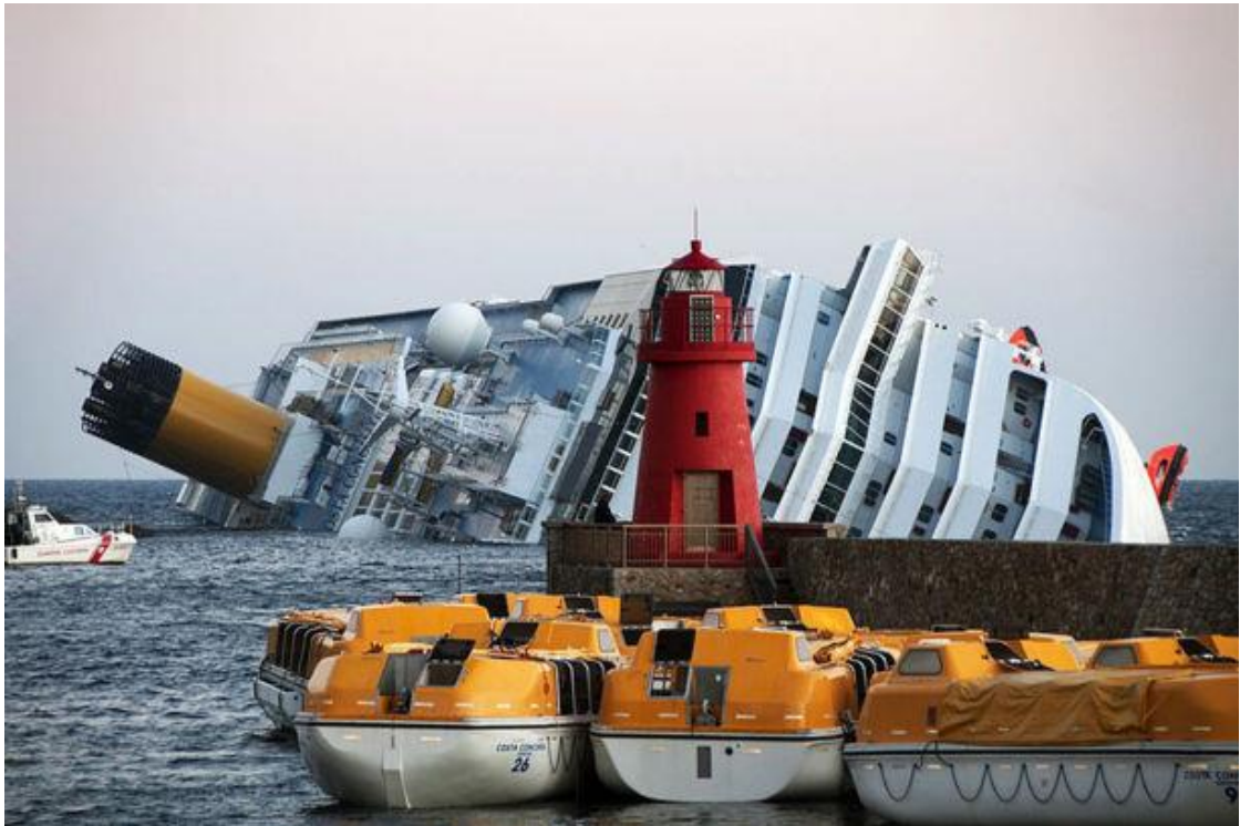
Illustration: Naufrage du Costa Concordia 13 janvier 2012

Mémoire pour l'obtention du Master 2 Droit maritime